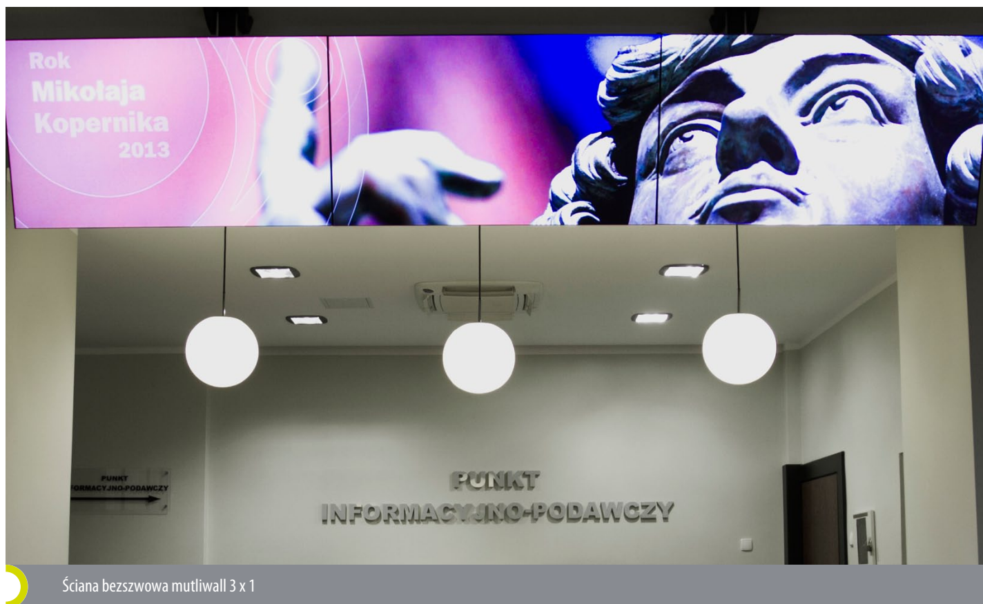
Ściana bezszwowa mutliwall 3 x 1

Rosnąca popularność mediów cyfrowych zapewnia dotarcie do odbiorców zupełnie nowymi kanałami. Wykorzystując ruch i dotyk można w innowacyjny sposób zaprezentować historię, która zainteresuje każdego. Technologia Digital Signage to cyfrowa dystrybucja multimedialnych treści, która kreuje nowy potencjał oraz jest doskonałą alternatywą dla statycznych nośników.