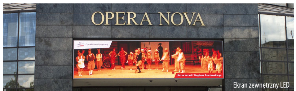
Ekran zewnętrzny LED

Dziedzictwo kulturowe to jedno z najważniejszych dóbr społecznych, element obrazu regionu oraz wyróżnik gwarantujący przyrwy turystów i pasjonatów danej tematyki. Nie dziwi wobec tego fakt, że promocja historii, sztuki oraz dóbr kulturowych jest ważnym celem samorządów, chcących zainteresować swoją ofertą mieszkańców oraz przybywających zewsząd podróżnych.