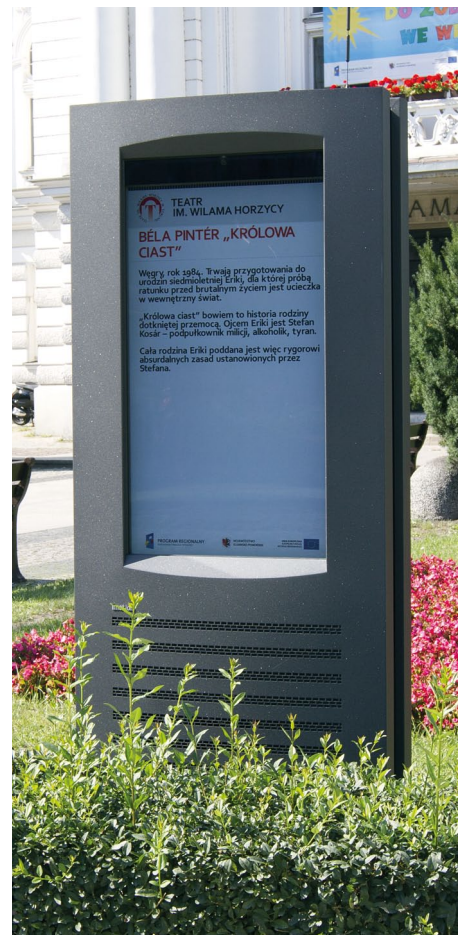
Totem zewnętrzny 46"

Promocja i integracja ośrodków kultury w całym województwie to cel projektu e-Usługi e-Organizacja - pakiet rozwiązań informatycznych dla jednostek organizacyjnych województwa kujawsko-pomorskiego - moduł e-Kultura . Nowoczesna forma, nietypowy sposób komunikacji, postęp technologiczny zawitał do przestrzeni publicznej – tak można określić sieć Digital Signage stworzoną na zlecenie Urzędu Marszałkowskiego Województwa Kujawsko-Pomorskiego.