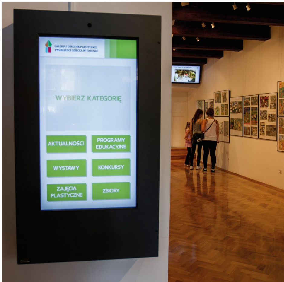
Interaktywny INFOMAT wewnętrzny z 42" ekranem dotykowym